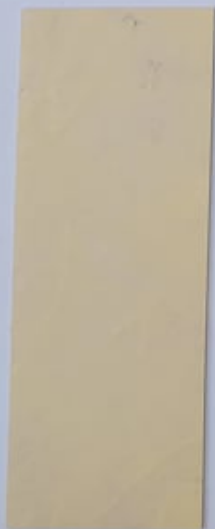
Santoline 1058-1 + PC121