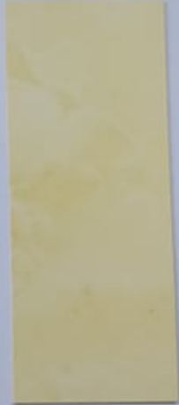
Genet 1067-2 + PC114