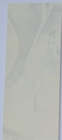
Allium 1067-2 + PC121