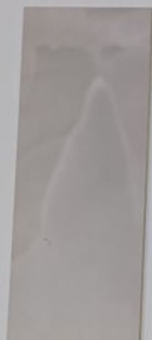
Pervenche 1139-2 + PC111