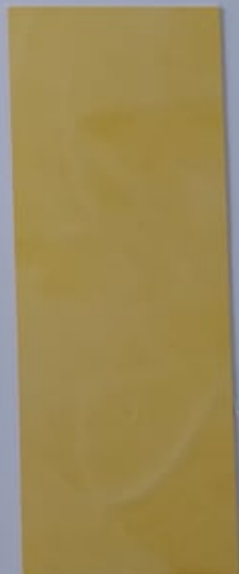
Capucine 1058-1 + PC114