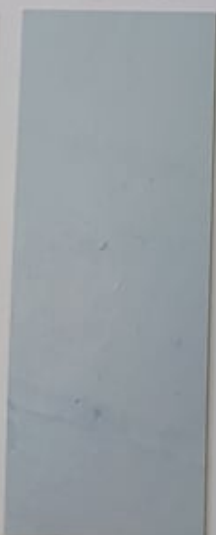
Muscari 1114-2 + PC121