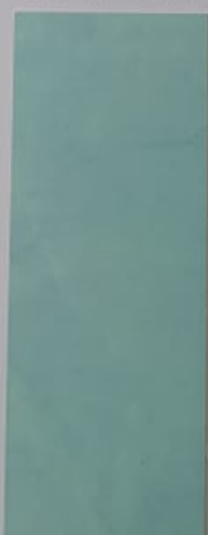
Campanule 1097-2 + PC121