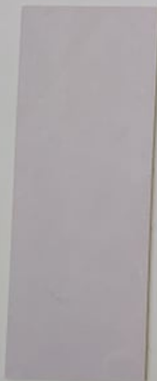
Gentiane 1139-2 + PC121