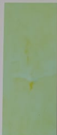
Kiwi 1097-2 + PC108