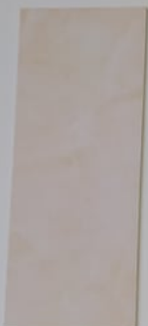
Pivoine 1151-5 + PC119