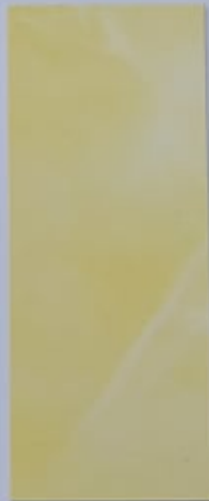
Renoncule 1067-2 + PC108