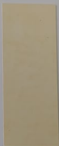
Melon 1149-2 + PC119