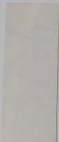
Volubilis 1149-2 + PC121