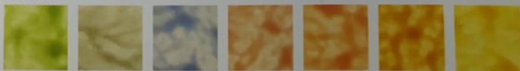
Vert PC 106