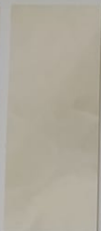
Fusain 1149-2 + PC 111