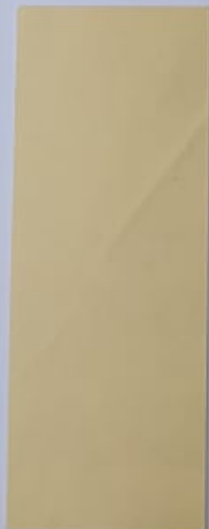
Cytise 1058-1 + PC111