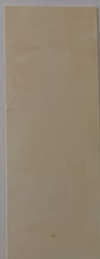
Clématite 1149-2 + PC109