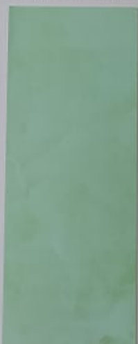
Menthe 1097-2 + PC106